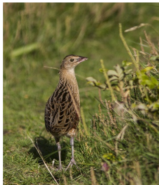
Referentens bonusinfo – billede af Engsnarre.

Økonomien i projektet er skredet. Dette skyldes bl.a. at man er nød til at erhverve flere arealer af hensyn til Engsnarre.